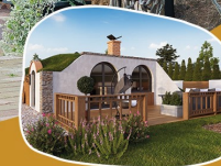
Wohn- & Officemodule

Außergewöhnliche Garten(t)räume - zahlreiche Möglichkeiten!