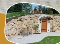
Erd- & Speisekeller